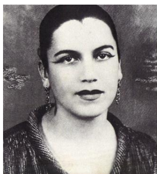
Tarsila do Amaral

Vários artistas Brasileiros e no mundo pintaram lindos quadros com o tema “ Família”. Nesta aula vamos conhecer a artista Brasileira Tarsila do Amaral. Ela é uma artista Brasileira que nasceu aqui no interior do estado de São Paulo. A Tarsila foi uma grande pintora e desenhista. Ela pintou um quadro chamado: A Família .